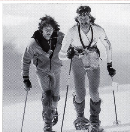
In copertina: «Navigare sulla neve e orientarsi». Uno sport nuovo? No! È antichissimo ed è stato riscoperto (adesso c'è l'ausilio della bussola...).

Documentazione Letture e immagini Nicola Bignasca 24