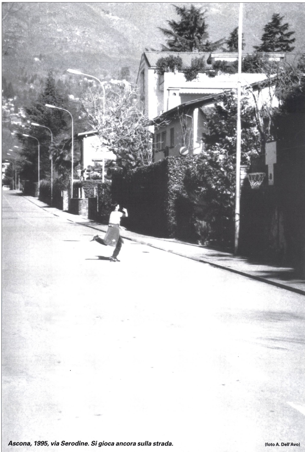
Ascona, 1995, via Serodine. Si gioca ancora sulla strada.