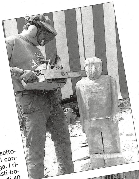
S - cultura Non solo agonismo, festa, fiera settoriale, bensì anche cultura, con il concorso di scultura con la motosega. I risultati sono strabilianti. Gli artisti-boscaioli dispongono di un tronco di 40 cm di diametro e alto un metro. Con la motosega creano vere e proprie opere d'arte. Assistere, vedere per credere.