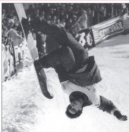
In copertina: uno sport da capogiro - è proprio il caso di dirlo. Daniel Käsermann, il nostro fotografo, ha fissato nelle sue immagini, impressionanti momenti del Campionato mondiale di Snowboard, svoltosi in marzo a Davos. Riferisce in «Reporter» a pag. 12 e 13.