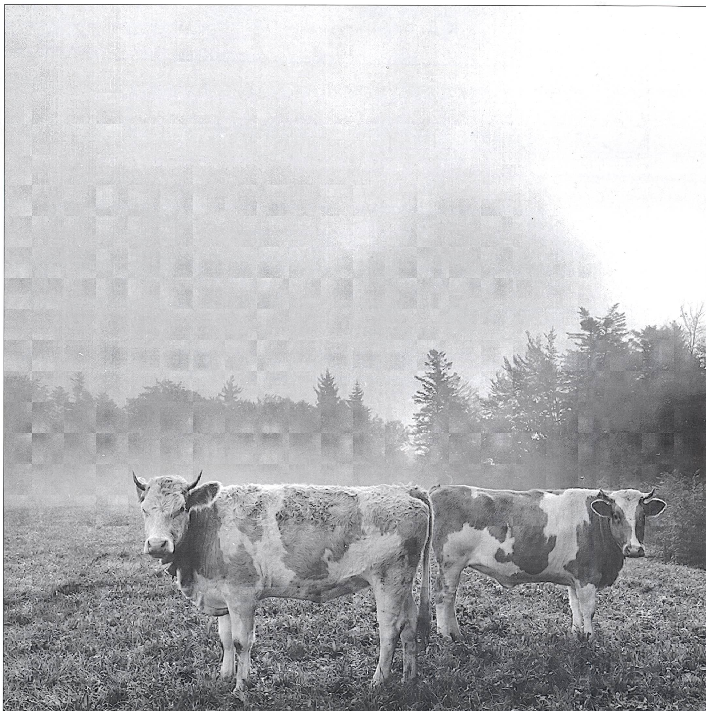
A Macolin non soggiornano soltanto gli sportivi!