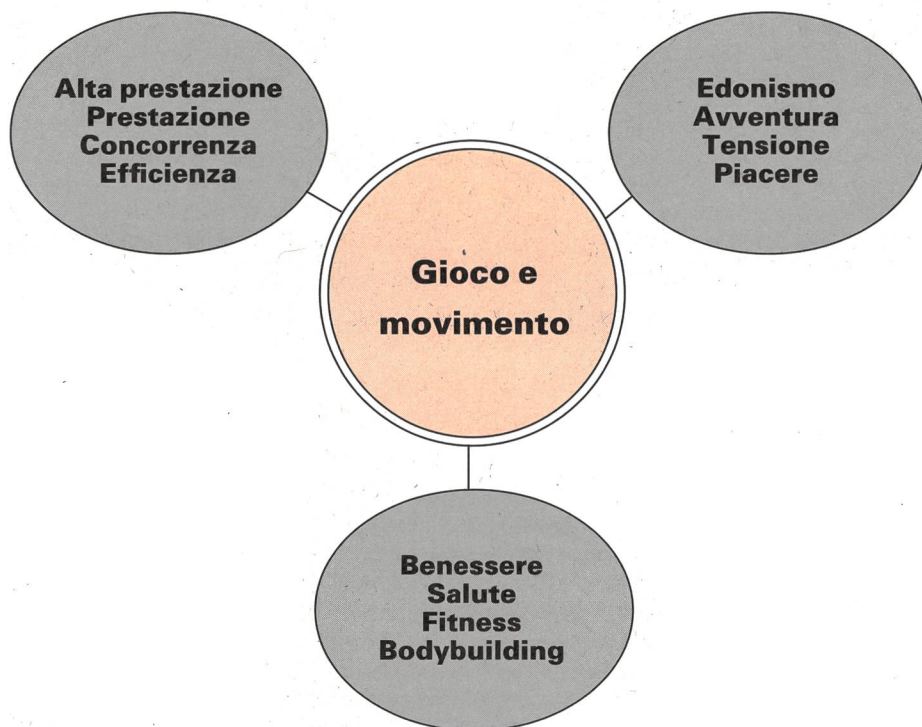
Fig. 2: Tendenze centrifugali di sviluppo nello sport.

Chi si arrischia a tastare, con una certa qual immedesimazione, i contorni di questo sport-colosso, è portato a costatare stupefacenti contrasti di contenuto. Chi segue i campi delle forze, giunge ai poli (cfr. fig. 2).