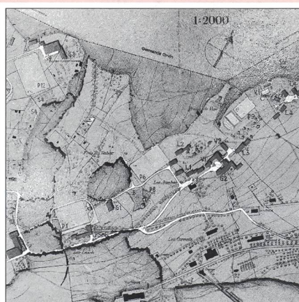
In copertina: la Scuola federale di ginnastica e sport di Macolin, così come si presentava nel 1947. Da allora, molto è cambiato ...