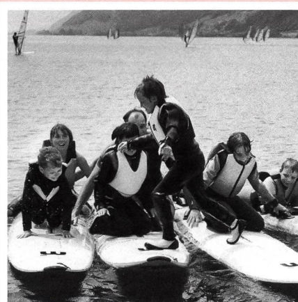
In copertina: imparare giocando, anche nel surf a vela. Con i giovanissimi occorre materiale adatto e poca teoria.