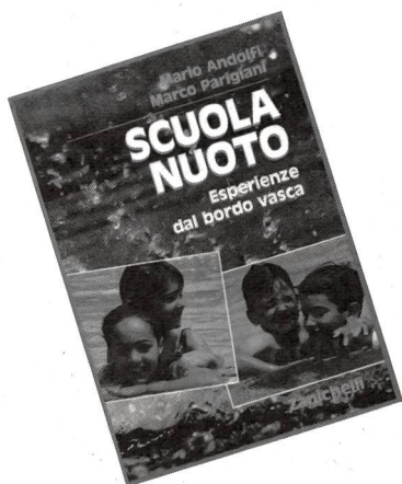
Andolfi M, Parigiani M.: Scuola nuoto - Esperienze dal bordo vasca , Zanichelli, Bologna, 1989, pagg. 304, ill.

La "scuola nuoto" è una tappa importante (se non indispensabile) per ogni bambino. Ai primi approcci all'acqua e al nuoto, la Zanichelli ha dedicato un interessante libro, nel quale gli autori, Mario Andolfi e Marco Parigiani, presentano tutte le componenti che si ricollegano all'apprendimento del nuoto. Il manuale è suddiviso in 6 sezioni ed è in grado di esaudire le esigenze delle categorie di lettori più disparate: dai genitori, che apprendono come avvicinare il bambino alla vasca d'ambientamento, ai docenti, che trovano la descrizione delle differenti nuotate o stili di nuoto, e, infine, agli istruttori, che acquisiscono le nozioni basilari per l'organizzazione dei corsi di nuoto.