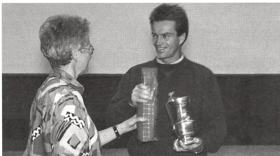
2 Bill Gilligan allenatore dell'anno: l'associazione degli allenatori diplomati CNSE ha eletto Bill Gilligan «allenatore dell'anno 1992». Il premio va ad un allenatore che ha dato ed ha avuto molto dall'hockey svizzero. Dopo un'esperienza positiva in Austria (4 volte campione austriaco con il Klagenfurt), egli ha vinto tre volte il campionato svizzero con il Berna e ha condotto la squadra nazionale ad un brillante 4° posto ai campionati del mondo (gruppo A) del 1992. Bill Gilligan è da poco anche molto attivo nel campo sociale, in quanto partecipa alla campagna «Senza droga - con lo sport» del progetto «partenza» («Start»). Egli allena settimanalmente donne e uomini, che si sottopongono ad una terapia con metadone.