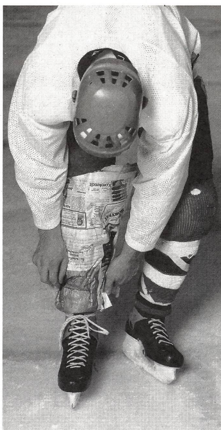
...ci si protegge come si può!

sabilità. La Federazione Internazionale di Hockey su Ghiaccio, conscia del fatto che la maggior parte degli incidenti avviene in seguito ad infrazioni di gioco, ha nettamente aumentato le punizioni per le irregolarità di gioco (cross check, bastone alto, trattenimento, colpo di bastone e check contro la balaustra). Tutti sono concordi sul fatto che il lavoro educativo nel giovane giocatore è importante. Trova pure tutti concordi la necessità di una regolamentazione più rigorosa di tutte le protezioni, protezioni che dovranno essere omologate per evitare che prodotti inefficienti inondino il mercato. Già parecchi anni or sono i responsabili della Lega Svizzera di Hockey su Ghiaccio hanno fatto passi importanti emanando consigli efficaci nell'intento di ridurre notevolmente gli incidenti a livello nazionale. Solo la stretta collaborazione tra tutti i responsabili (allenatori, coaches, arbitri e medici) porterà ad una profilassi efficiente. Si dovrà assolutamente evitare che questo bellissimo sport venga messo alle strette da regolamenti estranei all'attività sportiva come per es. da parte di assicurazioni, giuristi, ecc. e non da ultimo da politici. ■