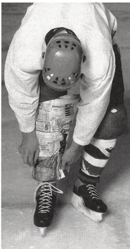
...ci si protegge come si può!

sabilità. La Federazione Internazionale di Hockey su Ghiaccio, conscia del fatto che la maggior parte degli incidenti avviene in seguito ad infrazioni di gioco, ha nettamente aumentato le punizioni per le irregolarità di gioco (cross check, bastone alto, trattenimento, colpo di bastone e check contro la balaustra). Tutti sono concordi sul fatto che il lavoro educativo nel giovane giocatore è importante. Trova pure tutti concordi la necessità di una regolamentazione più rigorosa di tutte le protezioni, protezioni che dovranno essere omologate per evitare che prodotti inefficienti inondino il mercato. Già parecchi anni or sono i responsabili della Lega Svizzera di Hockey su Ghiaccio hanno fatto passi importanti emanando consigli efficaci nell'intento di ridurre notevolmente gli incidenti a livello nazionale. Solo la stretta collaborazione tra tutti i responsabili (allenatori, coaches, arbitri e medici) porterà ad una profilassi efficiente. Si dovrà assolutamente evitare che questo bellissimo sport venga messo alle strette da regolamenti estranei all'attività sportiva come per es. da parte di assicurazioni, giuristi, ecc. e non da ultimo da politici. ■