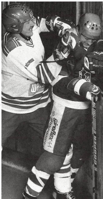
Il body check è la causa più frequente di infortunio.

Secondo l'INSAI (Istituto Nazionale Svizzero per l'Assicurazione Infortuni) durante il quadriennio 1963-67 sono stati registrati in Svizzera 2 680 incidenti durante la pratica dell'hockey su ghiaccio, cioè più dell'1% di tutti gli incidenti causati dalla pratica di uno sport. Nel quadriennio 1984-88 questa cifra raggiunse 19 922, cioè il 3% di tutti gli incidenti avvenuti durante la pratica di uno sport. Durante gli ultimi 5 anni si sono registrati 500 incidenti tra adolescenti di 14-20 anni, partecipanti a manifestazioni di «Gioventù e sport». L'hockey su ghiaccio primeggia nella statistica degli incidenti, considerato il numero dei partecipanti ad un'attività sportiva, precedendo il gioco del calcio, la pallamano e lo sci. Cifre analoghe ci sono fornite dalla Finlandia e soprattutto in modo molto meticoloso dall'Ente Assicurazioni Sociali Folksam della Svezia, dove si è registrato un raddoppio degli incidenti dal 1976 al 1983. Nell'ambito professionistico ovviamente un'incapacità nella pratica dello sport equivale ad un'inabilità lavorativa con i problemi sociali e finanziari che ne derivano. Per 1 000 ore di allenamento e