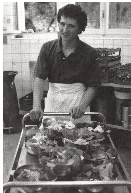
Sopra. Un campione olimpico in cucina: Hippolyt Kempf, campione olimpico nella combinata nordica, ha svolto recentemente il suo corso di ripetizione presso la cucina della SFSM.

Il premio Pittet del CIO ad Aldo Sartori è anche un riconoscimento di quanto il Ticino ha realizzato nel campo della promozione sportiva in tutti i settori: da quello popolare a quello agonistico d'alto livello. (ADA)