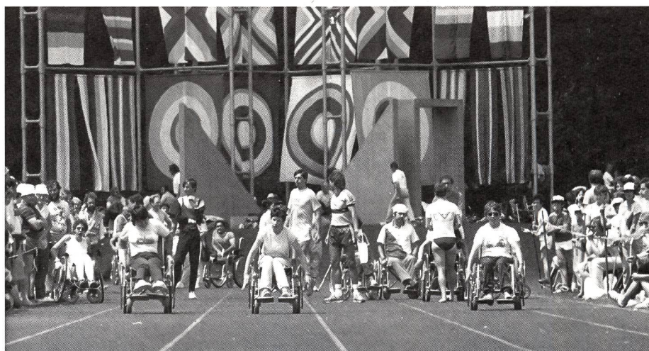
Anche i giovani invalidi hanno diritto a G + S.

Se un monitore segue un corso di perfezionamento in uno degli orientamenti della sua disciplina, soddisfa l'obbligo di seguire un CP per la disciplina in generale.