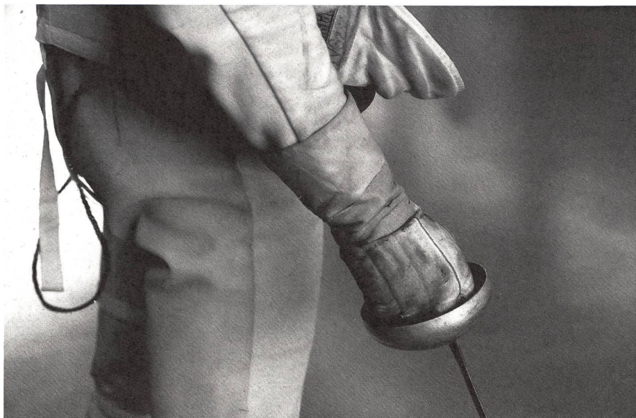
L'equipaggiamento ha un ruolo fondamentale nella scherma.

sono generalmente messe a disposizione dal club. Più tardi è consigliabile avere il proprio equipaggiamento.