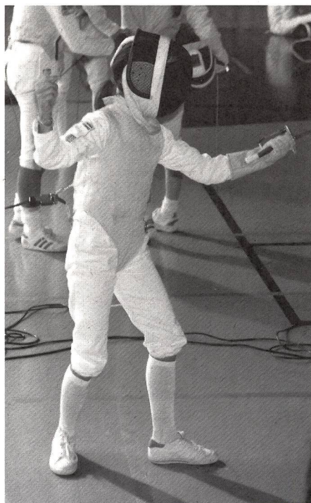
Una buona età per iniziare...

La scherma esiste da millenni, dal momento in cui l'uomo ha imparato a lavorare il legno ed il ferro, ha fabbricato delle armi per difendersi e per sopravvivere. Partendo dall'ascia di pietra per arrivare alla pistola del giorno d'oggi, passando per la lancia e arrivando al fioretto moderno, le civiltà - in particolare quelle latine -