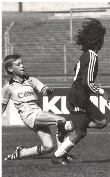
«Ridurre le esigenze della situazione, no; ridurre le esigenze tecniche, sì!»

Il processo cognitivo è finalizzato all'esecuzione di un movimento adeguato alla situazione. Perciò, le situazioni d'apprendimento vanno scelte per il loro valore cognitivo elevato. Ciò permette allo sportivo di applicare le conoscenze acquisite tramite i processi cognitivi in modo da migliorare la qualità dell'esecuzione del movimento nella situazione specifica.