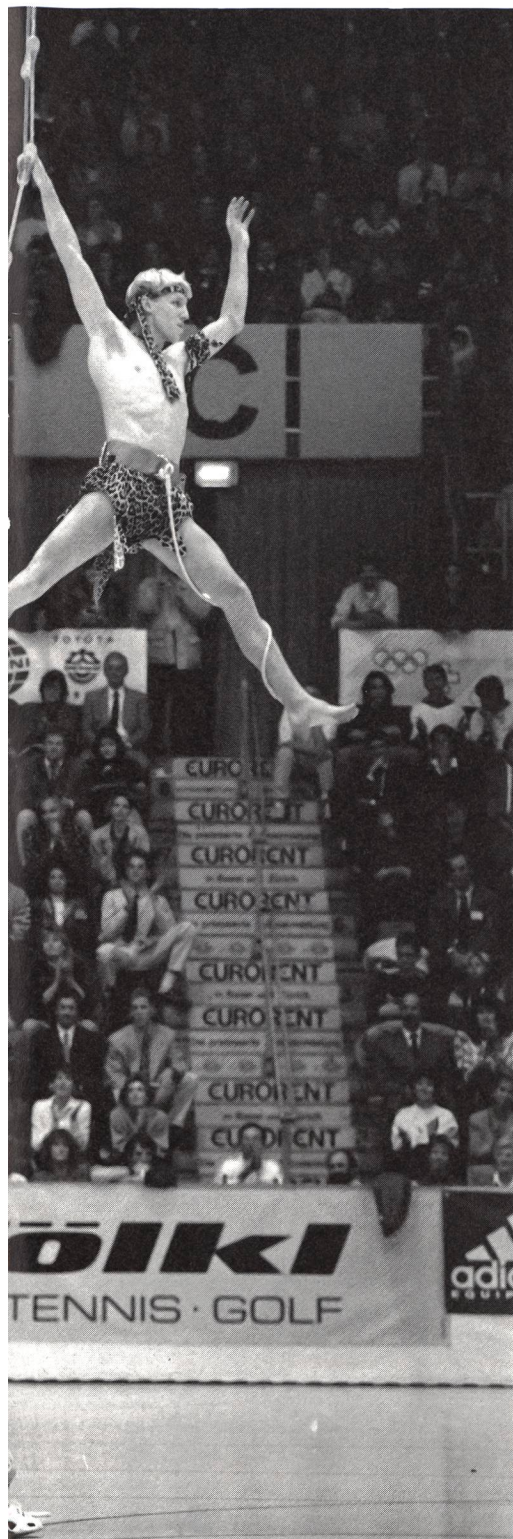
vedere molto bene la sua immagine ... ti i presenti!

Le prove iniziano ed è davvero interessante testare l'adattabilità degli atleti! Senza fare nomi, posso dire che molte volte ho pensato ... datti all'ippica! ... ma il detto di De Coubertin «L'importante non è vincere ma partecipare!» è in questo caso azzeccatissimo! Dopo la salutare pausa culinaria, ci si cimenta ora nel rock'n roll. Tanto per polemizzare quel tantino che basta, scelgo la cavia per la mia «analisi» e ... decido, tanto per andare a colpo si-