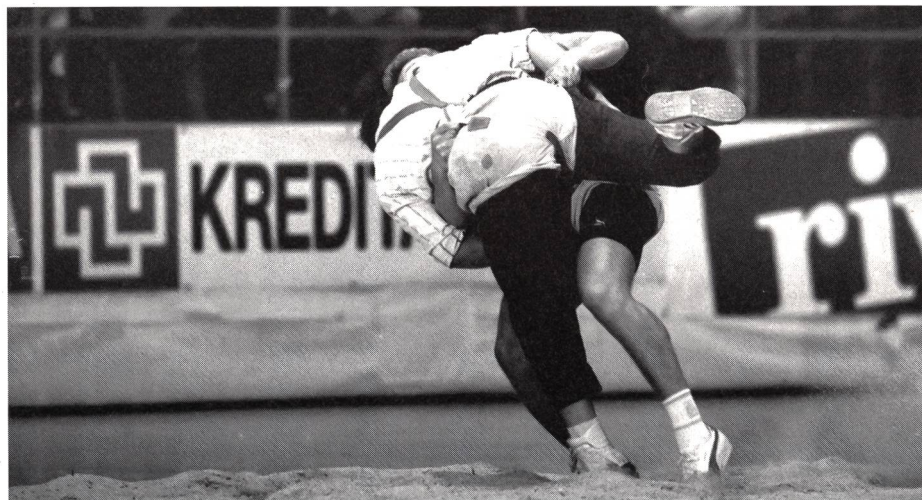
Anche nella lotta svizzera i talenti (?) non mancano!!

di Ellade Corazza