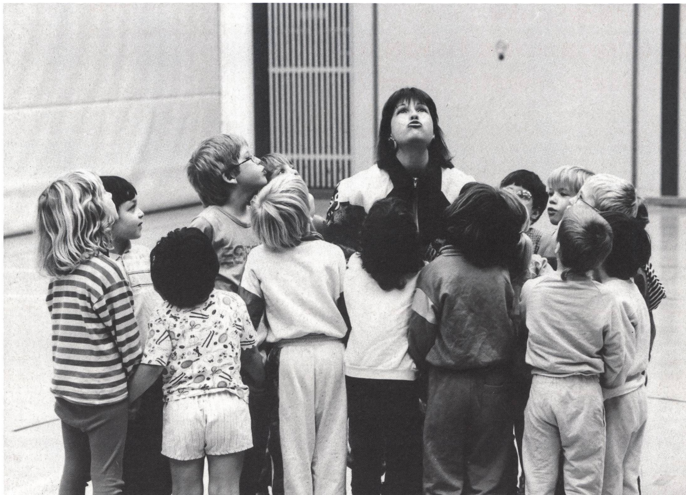
L'insegnamento dell'educazione fisica è fondamentale per lo sviluppo psicofisico dell'allievo.

materiali che affittiamo, sulle proposte a venire, ma abbiamo bisogno di un costante contatto coi soci. Questo può avvenire in modi diversi, anche semplicemente con una critica costruttiva, con una richiesta di informazioni, con la partecipazione alle riunioni mensili di Comitato che sono aperte a tutti e che si svolgono nella sede sociale, messa gentilmente a disposizione dal comune di Pregassona.