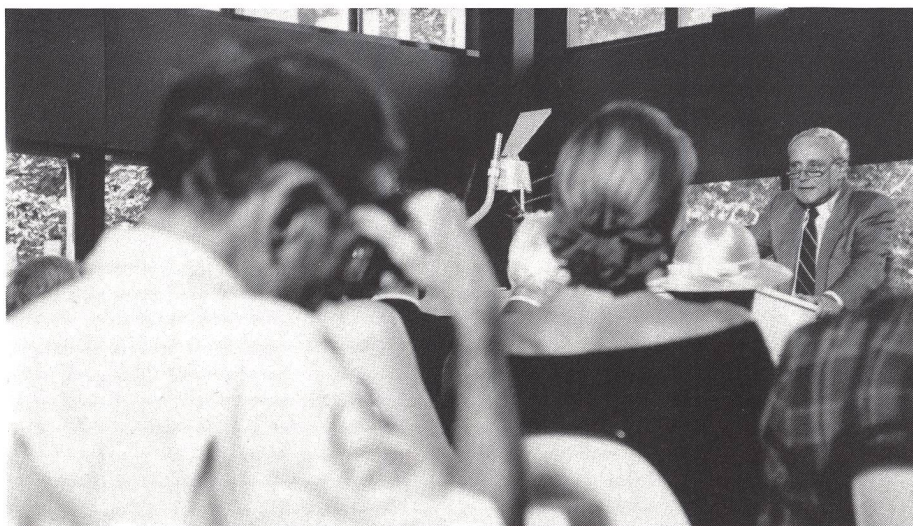
Per il futuro dello sport: coraggio e responsabilità.

Vecchi atteggiamenti presuntuosi, se ancora esistono, devono sparire. Ma non devono in nessun caso lasciar posto a complessi d'inferiorità che in nessun modo né la Svizzera né la sua popolazione meritano. Attacchiamo-