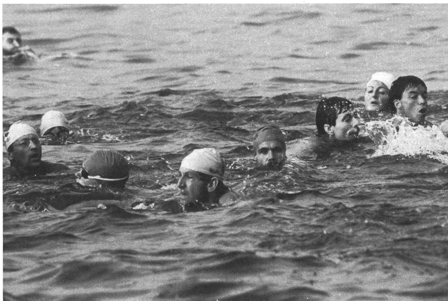
Prima di «salpare» è d'obbligo un esame di coscienza. Una «bevuta» di troppo e tutto può divenire più difficile...

è necessario, aiutare gli altri nuotatori!