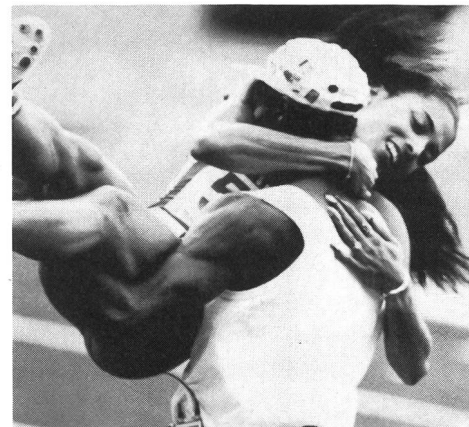
Florence Griffith tra le braccia del marito-allenatore Al Joyner dopo aver stabilito il nuovo primato del mondo sui 200 a Seul. L'unione tra i due, nella vita come nello sport, ha dato ottimi risultati.

Non si tratta del titolo di un nuovo film né di un capitolo di un testo sulle relazioni di coppia. Inutile quindi andarlo a cercare sui libri. Eppure qualcuno potrebbe un giorno farne oggetto di una relazione di medicina dello sport. Proviamo a scriverne le note introduttive. A Seul la bella Florence Griffith ha messo in riga le sue avversarie nei 100 metri ed ha vinto l'oro con il sorriso sulle labbra, pur aiutata da un vento che soffiava alle sue spalle a 3 m al secondo, nell'ottimo tempo di 10''54. Il suo record del mondo, 10''49 realizzato ad Indianapolis, diventa così più credibile per coloro che lo volevano viziato da qualche raffica di vento amico non rilevata dagli anemometri. Quando l'anno scorso avemmo la fortuna di incontrarla ai mondiali di Roma, aveva promesso di fare faville a Seul. A dire il vero all'epoca la Griffith suscitava l'interesse dei giornalisti più per il suo look eccentrico (lunghe unghie smaltate con colori differenti, tutine spaziali con sgambature vertiginose) che per i suoi tempi. Nell'arco di un anno, alla rispettabile (per una velocista) età di 29 anni, è riuscita a portare il suo personale sui 100 da 10''96 a 10''49. Quasi mezzo secondo, una enormità. Cosa è successo