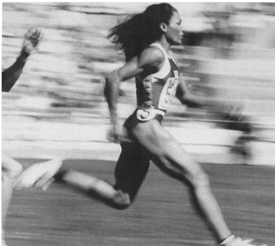
Due primati mondiali stabiliti nel giro di un'ora. La Griffith può essere a ragione ribattezzata la donna «bionica».

Povero uomo bianco! Le Olimpiadi di Seul hanno definitivamente confermato quello che medici e fisiologi vanno da tempo dicendo: l'uomo con la pelle scura corre più veloce di quello di razza bianca. Dallo sprint al mezzofondo ed al fondo, passando anche per gli ostacoli, gli atleti di colore hanno vinto tutto quello che c'era da vincere. A salvare la faccia della stirpe caucasica ha dovuto pensarci un italiano, Gelindo Bordin, vincendo la maratona più con il cervello che con le gambe. Per il resto l'uomo bianco è stato sempre ed irrimediabilmente battuto, anzi, spesso non ha avuto neanche la soddisfazione di poter accedere alla finale. Emblematica a questo proposito la linea di partenza della finale dei 100, con otto atleti di colore sui blocchi.