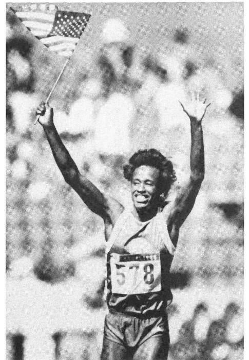
Jackie Joyner esulta dopo aver vinto l'oro nel salto in lungo. Anche per lei c'è a fianco un marito-allenatore, Bob Kersee.

È noto che gli steroidi anabolizzanti, le sostanze incriminate nel caso Johnson, sono ormoni maschili che in dosi minime sono prodotti anche dall'organismo femminile. Si sa anche che le donne che fanno molto sport hanno una bassa percentuale di grasso corporeo, in ogni caso molto minore rispetto alle sedentarie. Come conseguenza si ha che meno testosterone di produzione endogena viene convertito in estrogeni (ormoni femminili). Ne sanno qualcosa le atlete che spesso accusano amenorrea (scomparsa delle mestruazioni). In altre parole il testosterone invece che essere assunto come sostanza estranea, viene prodotto o secreto in dosi maggiori naturalmente. Un vero e proprio « doping endogeno » appunto, che consente un maggiore sviluppo delle masse muscolari nelle donne che praticano in maniera intensiva uno sport. □