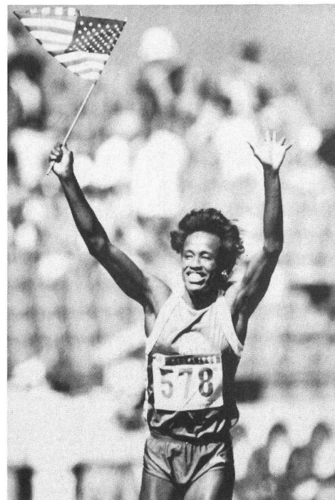
Jackie Joyner esulta dopo aver vinto l'oro nel salto in lungo. Anche per lei c'è a fianco un marito-allenatore, Bob Kersee.

È noto che gli steroidi anabolizzanti, le sostanze incriminate nel caso Johnson, sono ormoni maschili che in dosi minime sono prodotti anche dall'organismo femminile. Si sa anche che le donne che fanno molto sport hanno una bassa percentuale di grasso corporeo, in ogni caso molto minore rispetto alle sedentarie. Come conseguenza si ha che meno testosterone di produzione endogena viene convertito in estrogeni (ormoni femminili). Ne sanno qualcosa le atlete che spesso accusano amenorrea (scomparsa delle mestruazioni). In altre parole il testosterone invece che essere assunto come sostanza estranea, viene prodotto o secreto in dosi maggiori naturalmente. Un vero e proprio « doping endogeno » appunto, che consente un maggiore sviluppo delle masse muscolari nelle donne che praticano in maniera intensiva uno sport. □