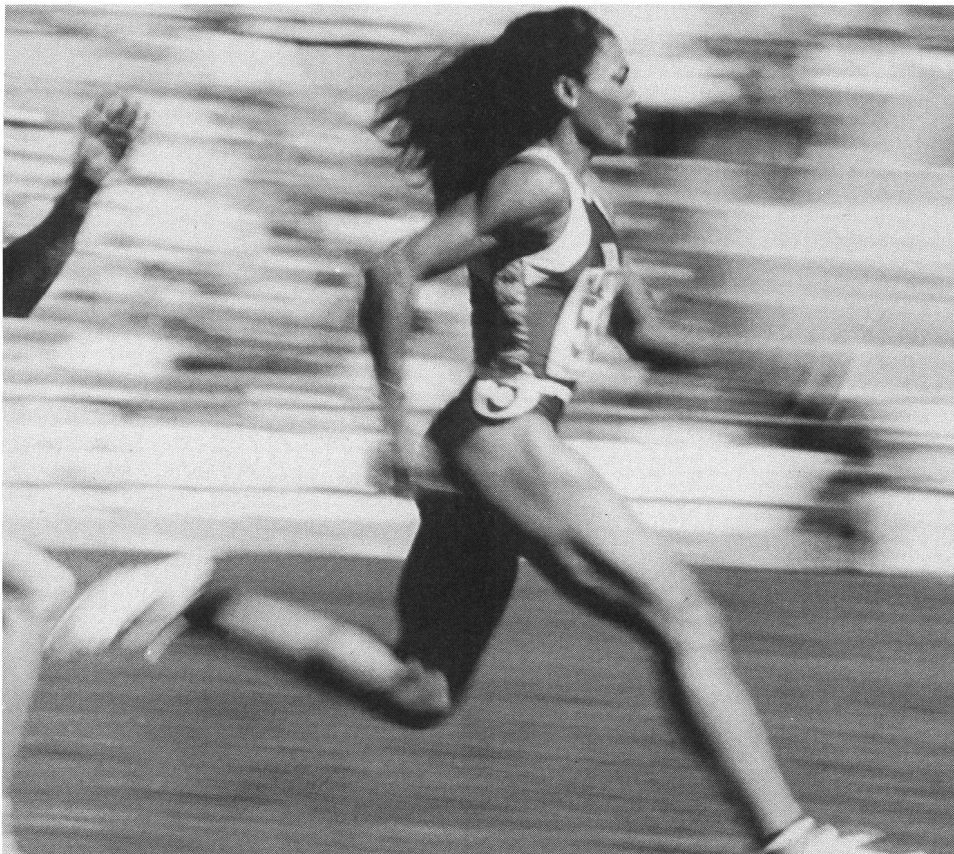
Due primati mondiali stabiliti nel giro di un'ora. La Griffith può essere a ragione ribattezzata la donna «bionica».

Molta acqua è passata sotto i ponti da quando Hitler si rifiutò di premiare il «negro» Jesse Owens alle Olimpiadi di Berlino, reo di aver clamorosamente sconfessato le deliranti teorie che predicavano una presunta superiorità della razza ariana. Owens dominò e vinse, come è noto, tutte le gare di velocità pura conquistando quattro medaglie d'oro (100, 200, lungo e 4 x 100). A