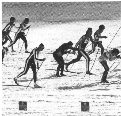
Sci di fondo

Presentiamo brevemente alcuni film e video-cassette entrati negli ultimi mesi a far parte della cine- e videoteca della SFGS. Fra le video abbiamo scelto solo quelle nello standard VHS. Ricordiamo che i gruppi G + S e altre associazioni sportive o cerchie d'interessati possono richiederli in noleggio gratuito. Data l'enorme richiesta (soprattutto per gli sport stagionali, ad esempio lo sci), i film devono essere prenotati e ordinati con molto anticipo, precisando la data di protezione, indicando inoltre il numero di codice del video (V xx.xxx) o film (F xx.xxx) e rispediti per espresso immediatamente dopo la proiezione alla Mediateca della SFGS - 2532 Macolin (032/22 56 44).