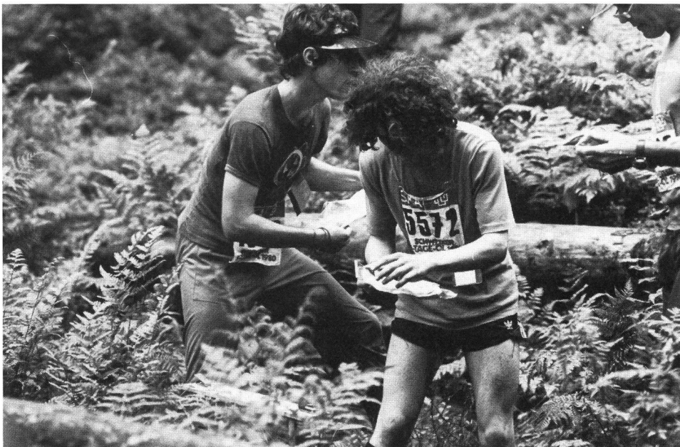
Da che parte lo sport?

Esistono regole precise per ogni sport che fissano i limiti entro i quali i concorrenti si devono muovere, ma ovviamente queste norme non bastano più. Forze e obiettivi della società sembrano essere più forti. Noi 'uomini sportivi' dovremmo sviluppare una capacità al di sopra dei regolamenti sportivi e al di sopra delle forze della società. Abbiamo bisogno di un orientamento di base , una specie di dimensione in più . Sportivi e spettatori, giovani e anziani, dilettanti e atleti di punta sottoposti al rispetto di questo ideale etico-morale. Ma il comportamento di certi spettatori a Crans-Montana, interesse squadre di hockey su ghiaccio durante i loro incontri del campionato e altri avvenimenti saltuari nell'attività sportiva di tutti i giorni, ci mostrano che la strada da percorrere è ancora lunga. Questa dimensione in più deve essere l'obiettivo principale nella politica e nell'educazione dello sport. Isolato, lo sport non basta. Ci vuole una base solida, un orientamento etico che aiuti a trovare i veri valori dello sport.