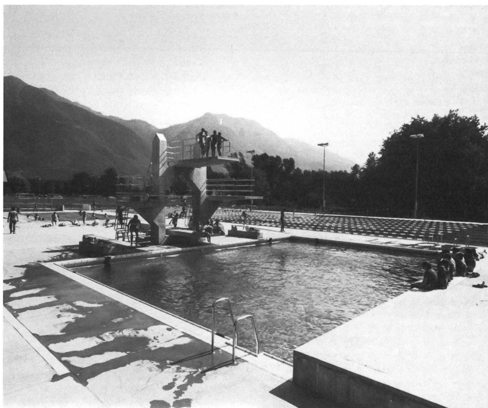
I magnifici impianti per il nuoto e i tuffi del CST

Nei prossimi anni il CST sarà ulteriormente potenziato. Sono allo studio impianti sportivi (pista d'atletica di 400 m, piscina coperta) e logistici (mensa, alloggi, uffici e impianti del tempo libero).