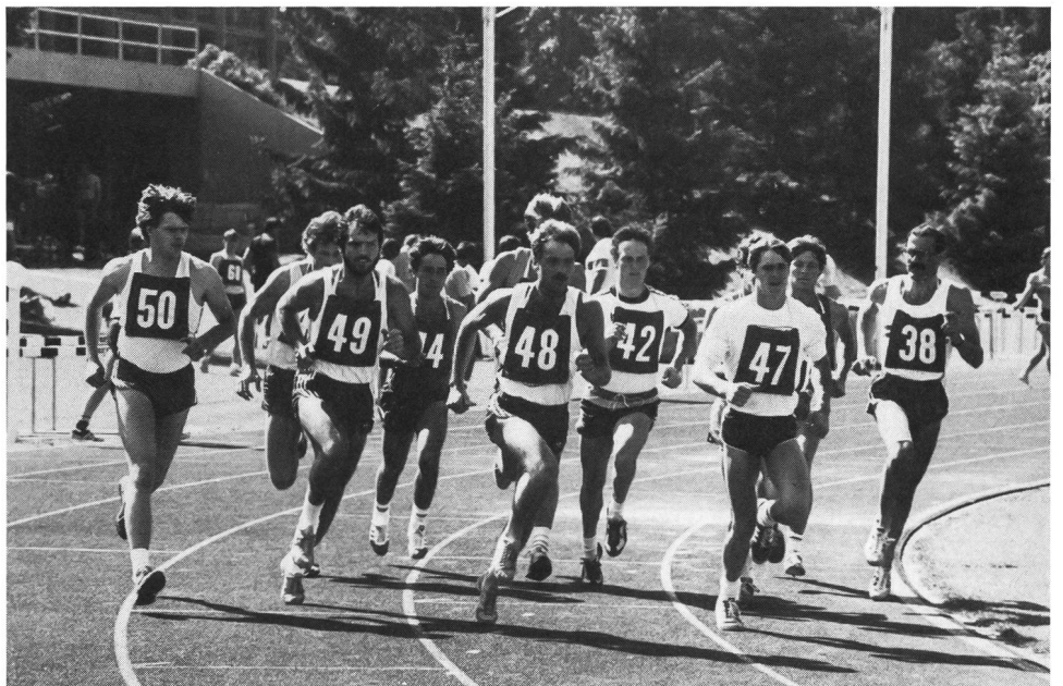
Un'istantanea degli esami d'ammissione del 1985.

Gli sportivi di élite (in possesso di un certificato CNSE) interessati si devono inoltre informare presso le rispettive federazioni.