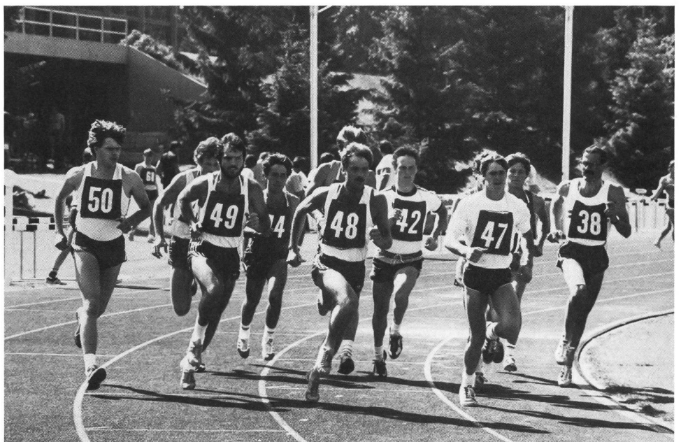
Un'istantanea degli esami d'ammissione del 1985.

Gli sportivi di élite (in possesso di un certificato CNSE) interessati si devono inoltre informare presso le rispettive federazioni.