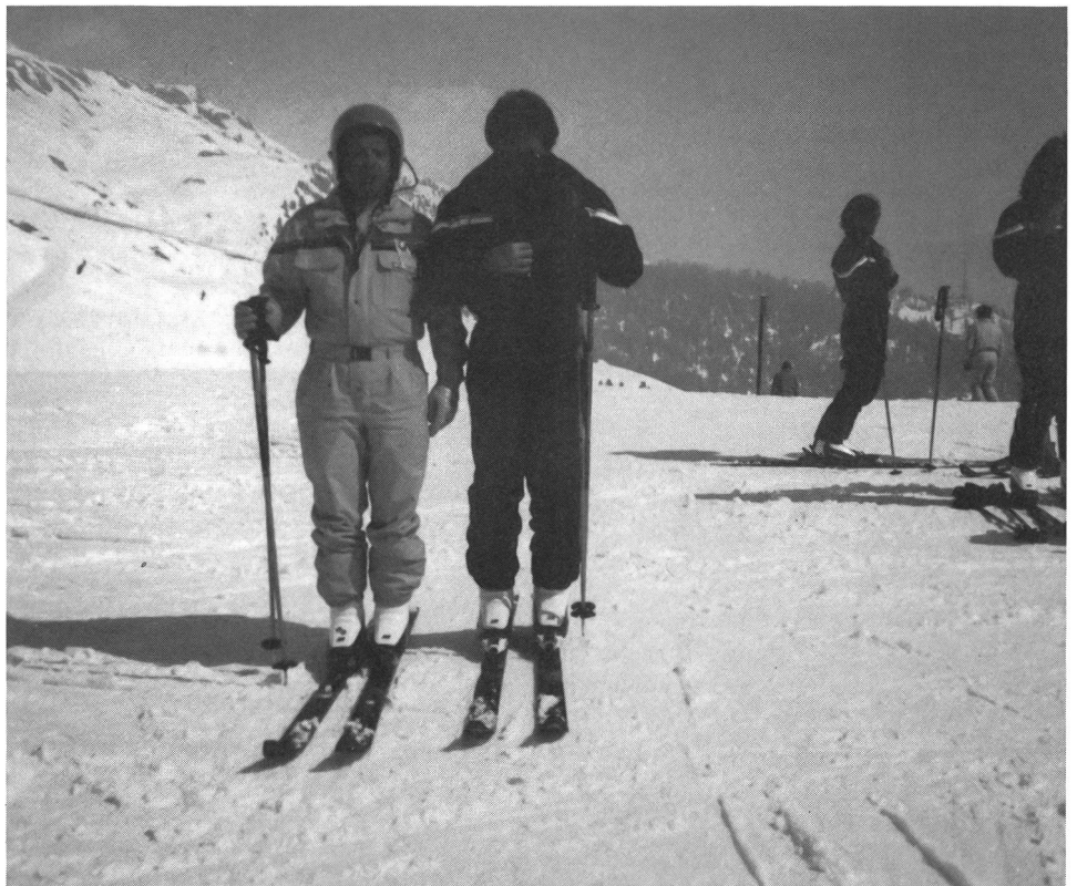
Il cieco e la sua guida: due amici per la pelle

«Il Congresso mondiale di Interski è un raduno che viene organizzato ogni quattro anni e che vede riunite le selezioni dei migliori maestri di sci delle nazioni alpine e delle altre nazioni dove lo sci viene insegnato e praticato. Le dimostrazioni hanno lo scopo di mostrare come viene insegnato lo sci nelle diverse scuole (scuola svizzera, scuola francese, austriaca, ecc.) presentando eventuali novità nel campo dell'insegnamento e nell'uso del materiale didattico. La dimostrazione prevista, al cospetto dei maestri di sci provenienti da tutto il mondo permetterà di riflettere sulle metodologie dell'insegnamento dello sci a diversi livelli traendo validi spunti che si potranno applicare anche alle persone perfettamente sane. Sciare su qualsiasi pendio in mezzo agli sciatori comuni sarà la migliore dimostrazione del livello raggiunto; oggi i ciechi e le loro guide sono in grado di risalire con qualsiasi impianto (sci lift a piattello, ad ancora, seggiovia, telecabina ecc.) e di scendere su qualsiasi pista evitando le insidie dei paletti di demarcazione, dei punti stretti e degli altri sciatori, divertendosi naturalmente. Tutto questo sarà sicuramente una novità che avrà senz'altro un eco positivo anche Oltreoceano. Le esperienze del GTSC sono una tangibile prova di una positiva integrazione fra ciechi e sportivi normali».