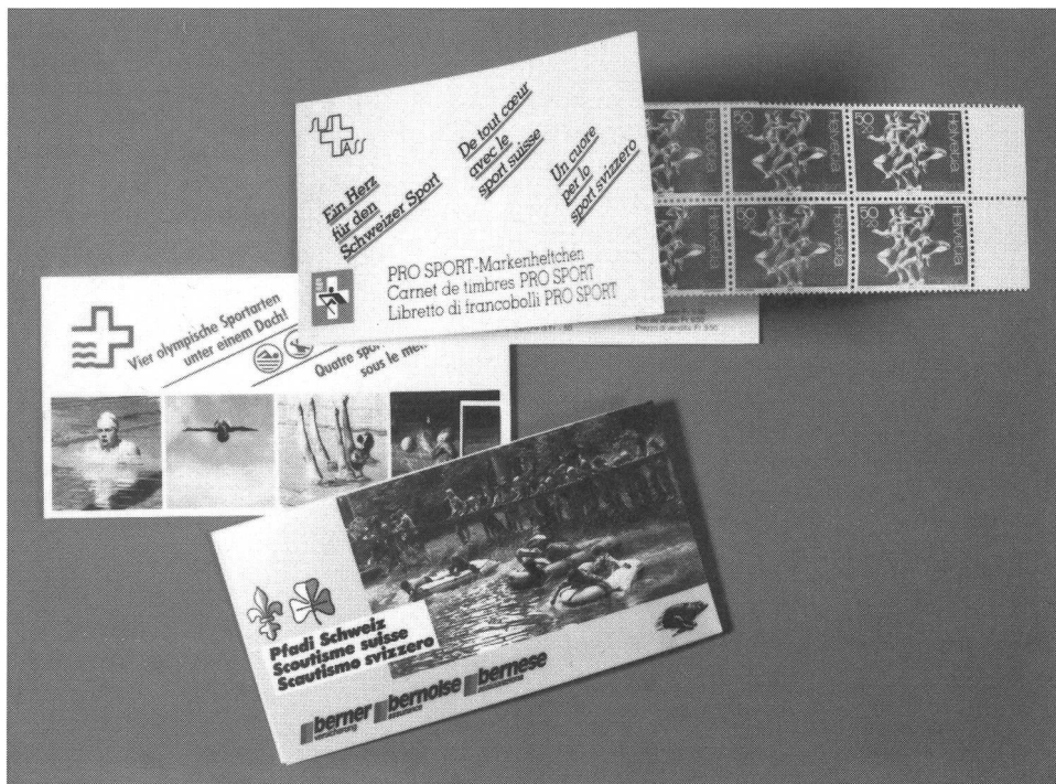
Il francobollo PRO SPORT offre una vasta gamma di prodotti: dal pratico libretto a dieci pezzi a speciali ricercati pezzi di collezione per filatelici.

Del francobollo PRO SPORT sono previste otto emissioni in 20 anni. Ogni volta, il francobollo sarà, di regola, del valore più corrente (attualmente 50 centesimi), accompagnato da una soprattassa di 20 centesimi. □