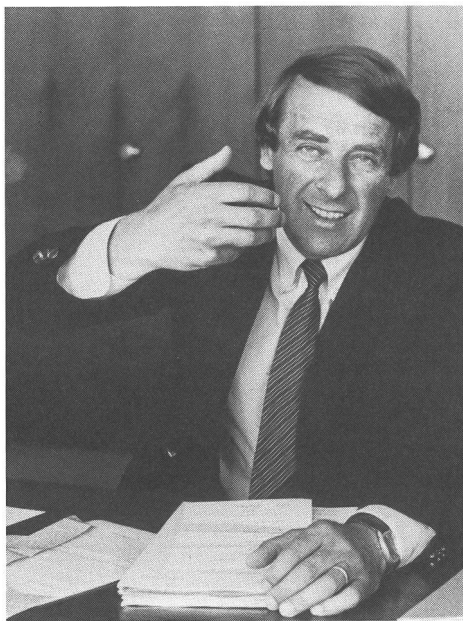
Il Consigliere nazionale Adolf Ogi «padrino» del francobollo PRO SPORT.

Il 23 giugno 1983 può essere considerato come una pietra miliare nella storia dello sport svizzero. Infatti, in tal data, il Consiglio nazionale accettava a grande maggioranza — 82 voti favorevoli e 12 contrari — il postulato di Adolf Ogi per il lancio del primo francobollo sportivo con soprattassa. L'ASS considera questo risultato una più che positiva dimostrazione di fiducia nella causa dello sport svizzero. Notevolissimo è stato anche il contributo del Consiglio federale, e questo nel mettere in vigore, col 1° di marzo 1985, un importante cam-