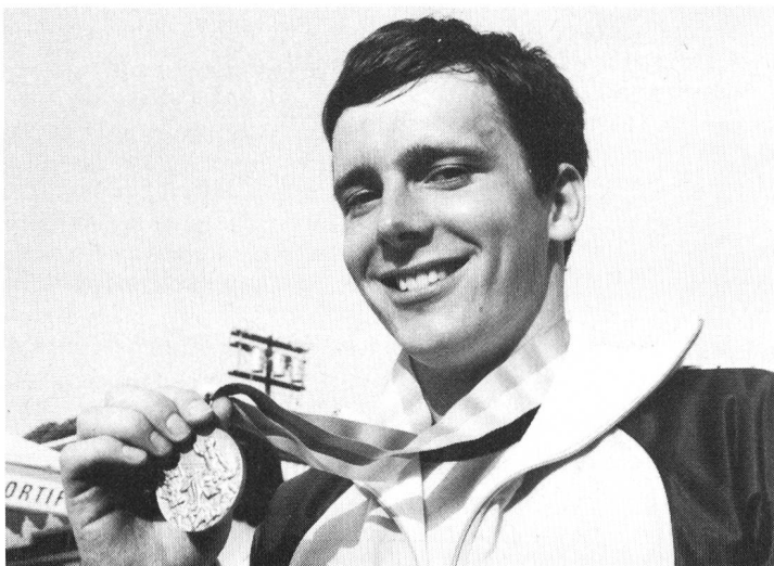
Una medaglia ancora pura; ma quanti sacrifici! (ASL)