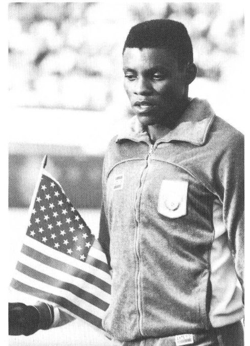
Carl Lewis ai Giochi di Los Angeles. Successo storico a stelle e strisce.

Ecco, queste le tematiche che a metà mese verranno affrontate nel corso del Simposio di Macolin. Non sarà facile formulare le preventivate «tesi» sul futuro dello sport. Facciamo di nuovo uno strappo alla regola e dichiariamoci ottimisti, almeno per lo sport. □