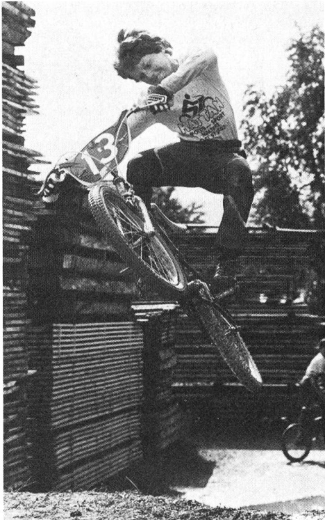
In America esistono già 100000 corridori di Bi-Cross tesserati.