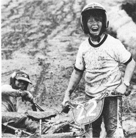
Con questa sporcizia, anche la mamma avrà i suoi problemi