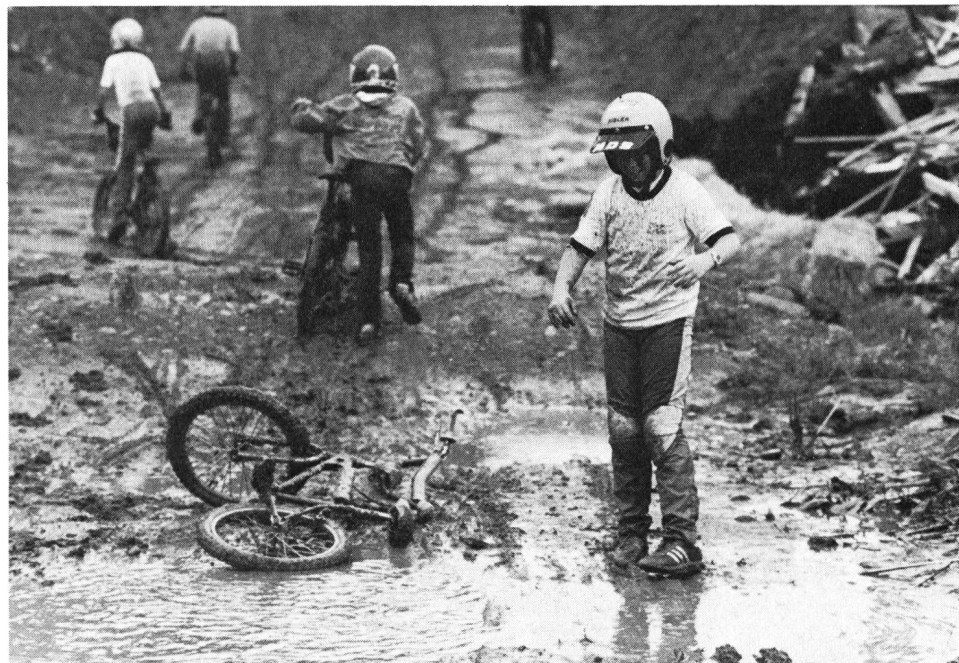
Anche le cadute fanno parte del programma

piede anche in Europa, estendendosi molto velocemente, soprattutto in Olanda, Inghilterra, Belgio e Francia. Mentre in America ci sono attualmente 100 000 corridori tesserati, in Svizzera si svolgerà, per la prima volta quest'anno, un campionato con 70 attivi.