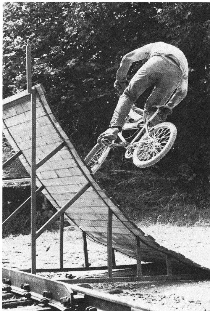
Il percorso della parete di legno con un avvitamento finale di 180°