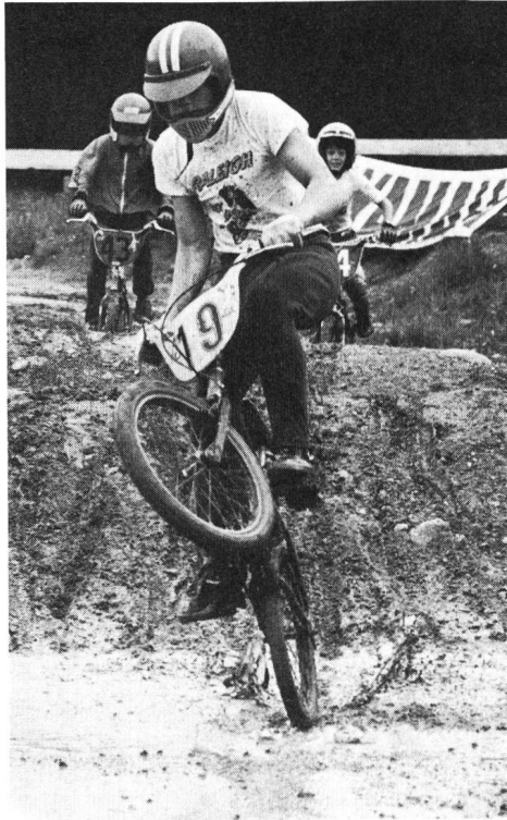
Su una pista ondulata si evidenziano contemporaneamente forza e tecnica