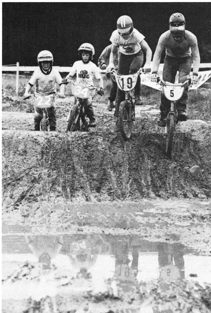
Un tirocinio per il moto-cross?