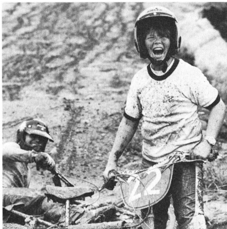
Con questa sporcizia, anche la mamma avrà i suoi problemi