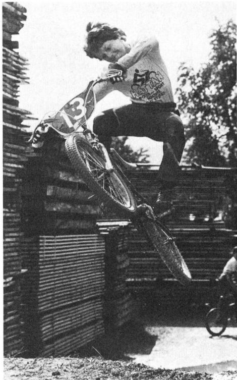
In America esistono già 100 000 corridori di Bi-Cross tesserati.