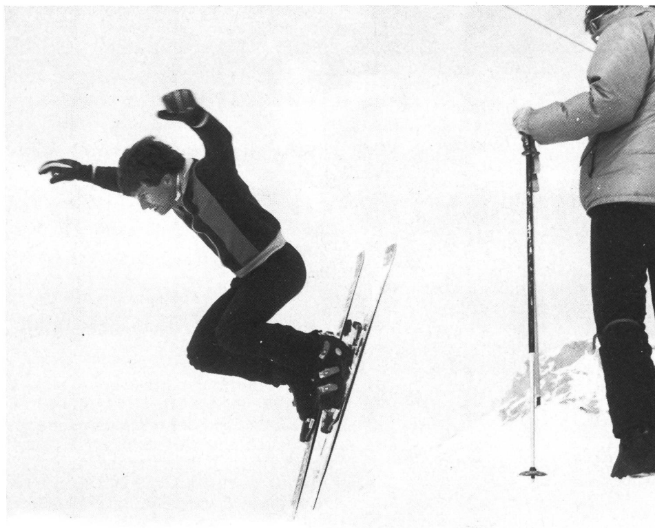
Esercizi di sci acrobatico alla portata di tutti