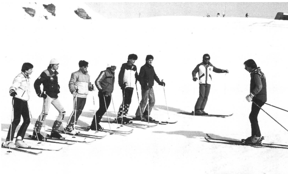
Insegnamento di un moniteur sotto l'occhio attento del capo-classe

I monitori che non sono ingaggiati nell'insegnamento o nella preparazione di un'attività speciale, sono obbligati ad iscriversi alla competizione o allo sci