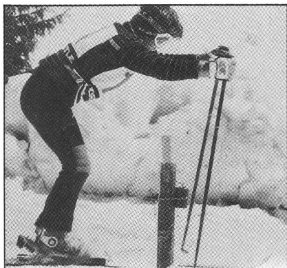
Fase di preparazione