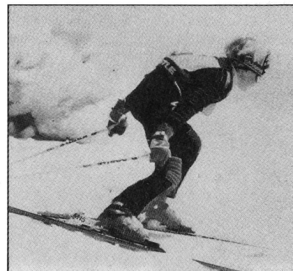
fig. 2 Fase di scivolamento fig. 3