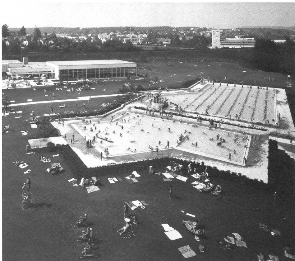
Impianti che si prestano sia al tempo libero e allo sport d'élite, sia allo sport scolastico.

Gli impianti sportivi sono spesso utilizzabili in molteplici modi; offrono ai loro diversi utenti tutta una gamma di possibilità d'esercitare uno sport, un gioco o altre attività di tempo libero. È così che, per esempio, una palestra permette, a seconda delle dimensioni, la pratica della ginnastica ma anche dei giochi più svariati su piccoli campi. Lo stesso dicasi per un