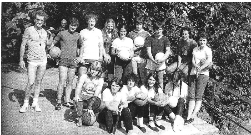
Monitori e partecipanti del promozionale d'Intragna.