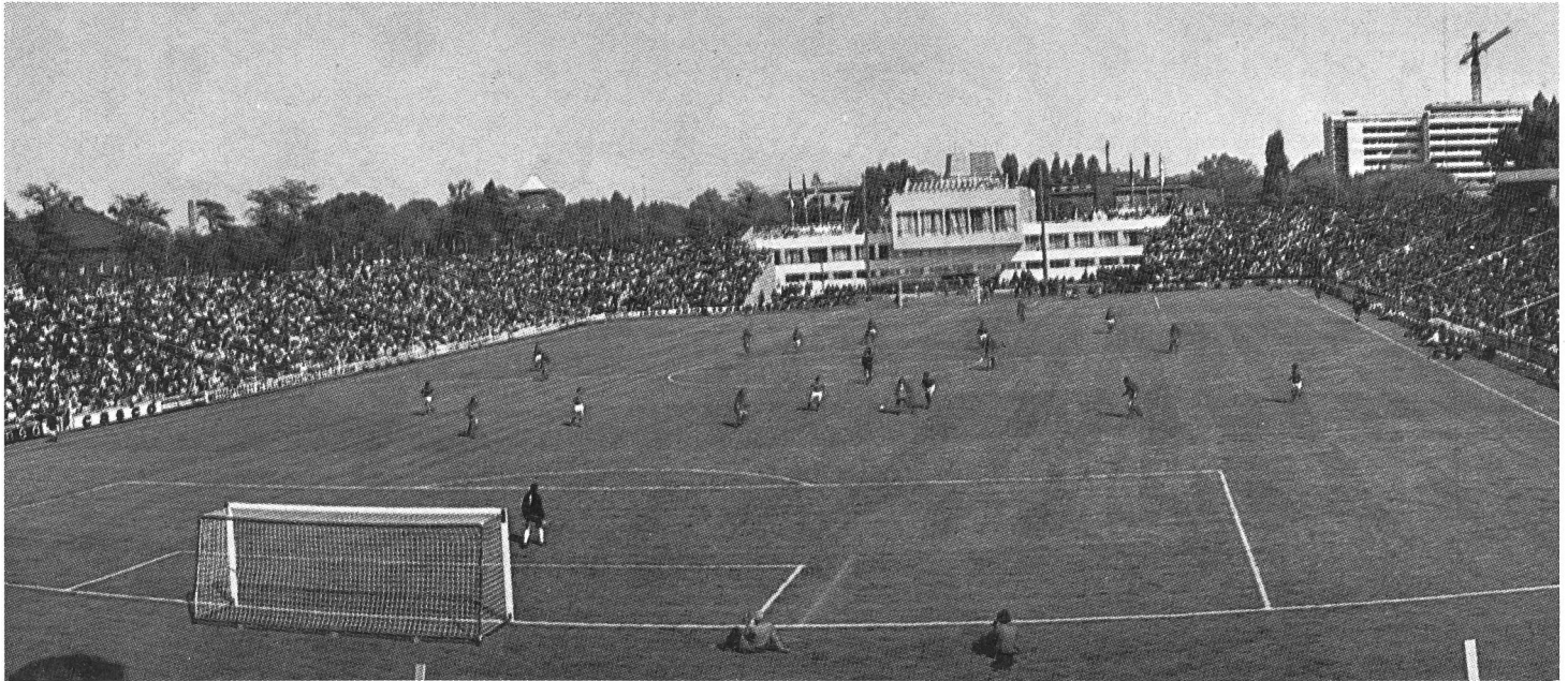
Uno dei numerosi stadi di calcio di Budapest.

pano inoltre dello sport di base, hanno una gestione indipendente come pure indipendente è l'amministrazione degli impianti.