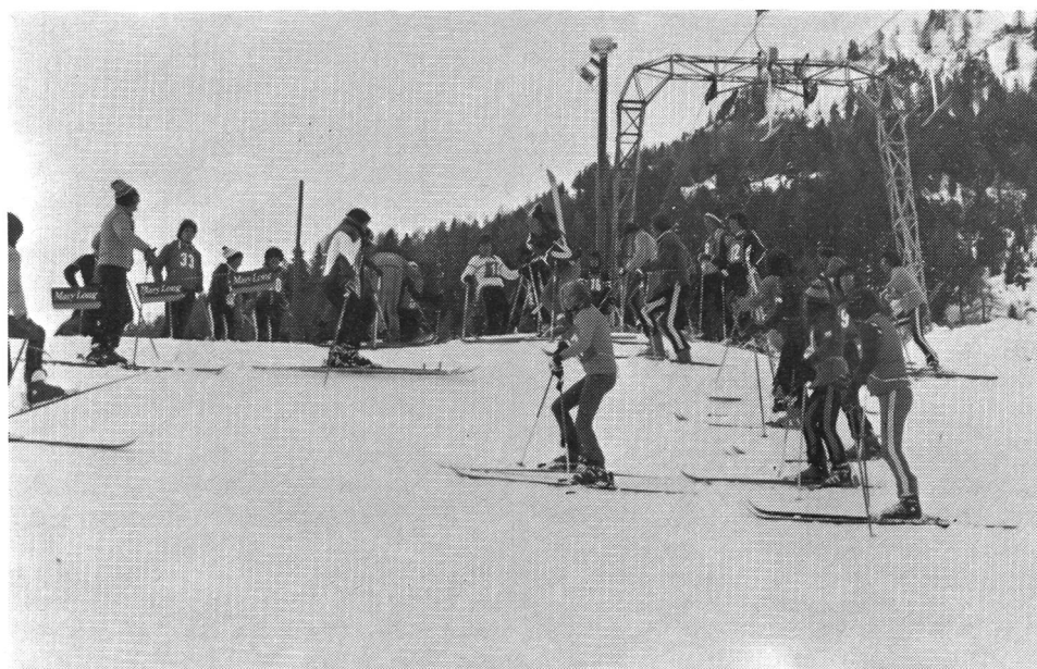
Lo sci, lo sport preferito in G+S.

La maggior entrata è derivata dalla più accentuata attività svolta dalle Associazioni e dai Gruppi che ha, per riflesso, influito positivamente sulla percentuale spettante al Cantone. Inoltre l'aumento sensibile dei sussidi per i corsi monitori è dovuto al fatto che nel 1976 furono organizzati parecchi corsi di aggiornamento, annullati nel 1975 in conseguenza delle misure di risparmio imposte dalla Confederazione. Dal 1° gennaio 1975 ogni monitore qualificato è tenuto ad effettuare un corso di aggiornamento ogni 3 anni, anziché ogni 2 anni.