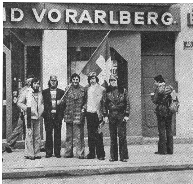
Sano tifo svizzero per le vie di Innsbruck.

Gli elvetici hanno terminato la trasferta tirolese con risultati inferiori alle speranze (non si pretendevano i risultati di quattro anni or sono, con le dieci medaglie di Sapporo, ma si attendeva qualcosa di più) in quanto hanno deluso le ragazze: sulle loro prestazioni, a mano dei risultati della preparazione e delle gare preolimpiche di coppa del mondo e di Europa, era lecito (e giustificato) attendersi qual-