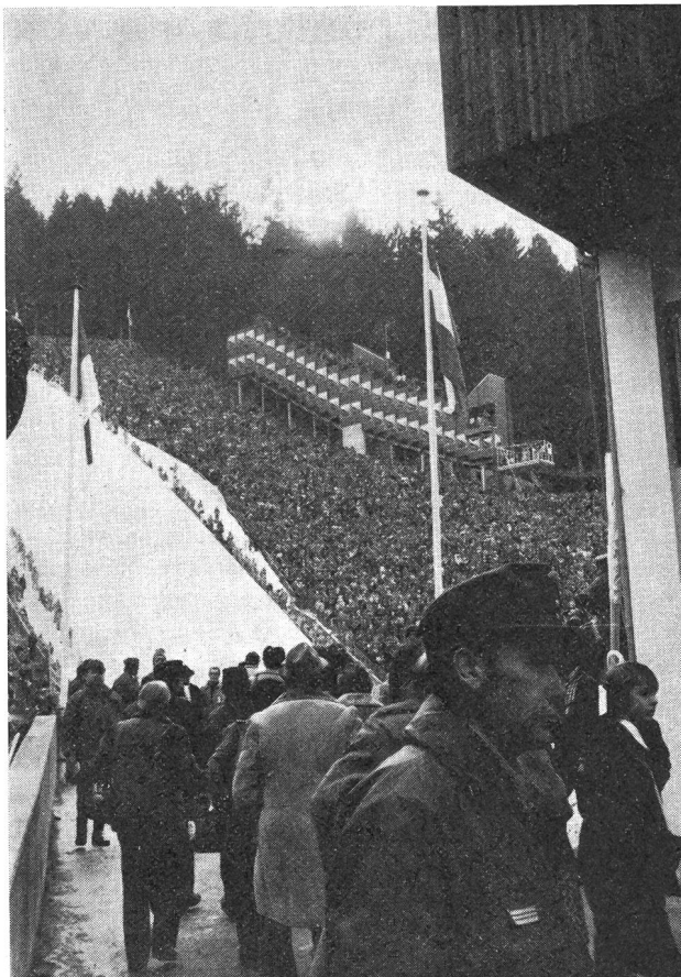
La folla: una impressionante visione di parte degli spettatori che si sono recati al Bergisel per la cerimonia di apertura dei GO di Innsbruck 1976, alcuni già dalle otto del mattino (la cerimonia ha avuto inizio alle ore 14.30 e vi hanno assistito, per ben due ore, oltre 70 000 appassionati degli sport invernali. Tanto può lo sport...).

che medaglia: che non è venuta (specie dalle slalomiste, che si erano distese nella tranquillità di Schuls/Scuol, la «porta di Olimpia» come era stata denominata la nota stazione termoclimatica della Bassa Engadina siccome a soli 13 km da Innsbruck e l'ultima località importante in Svizzera) e su cui si sta indagando alla ricerca di qualche causa che possa servire quale giustificazione. Noi crediamo e pensiamo che a Innsbruck si sia giunti quando la curva della forma era già, quasi per tutti gli atleti, in fase discendente: nel mese di gennaio, intensissimo di competizioni, gli atleti — qualcuno magari per conquistare la selezione — hanno dato tutto e si sono, come si suol dire, spompatis: ed è quindi naturale che sulle piste olimpiche non abbiano più potuto dare il massimo; contrariamente a altri che, magari, si sono risparmiati, e qui affiorano i nomi di Heini Hemmi e Ernst Good, unitamente a Russi, e sono sbocciati in pieno sulle nevi di Axamer Lizum.