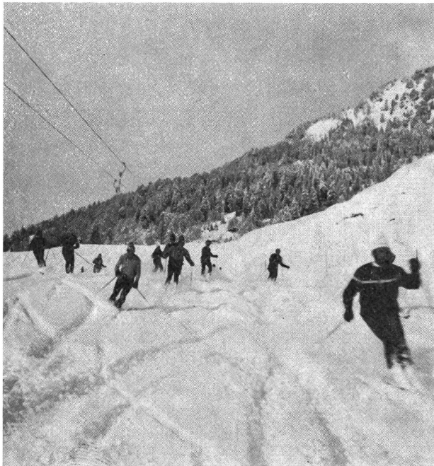
Futuri monitori G+S al lavoro pratico

Blenio e alla dir. della FLOC di Locarno-Cardada per la comprensione e lo spirito di collaborazione dimostrati, mettendo a disposizione, esclusivamente dei corsi G+S, gli impianti di risalita, dando in tal modo un contributo tangibile e concreto agli organizzatori. Secondariamente non possiamo esimerci dall'estendere un vivo plauso agli istruttori, già citati sopra, grazie ai quali è stato possibile offrire ai partecipanti un insegnamento qualitativo e tecnicamente pregevole. Inoltre degli istruttori va messo in giusto rilievo il loro senso di dedizione che li ha portati parecchie volte a restare operanti fino a tarda sera. Queste prestazioni spontanee e disinteressate dovrebbero essere maggiormente comprese e valutate anche dai nostri superiori!