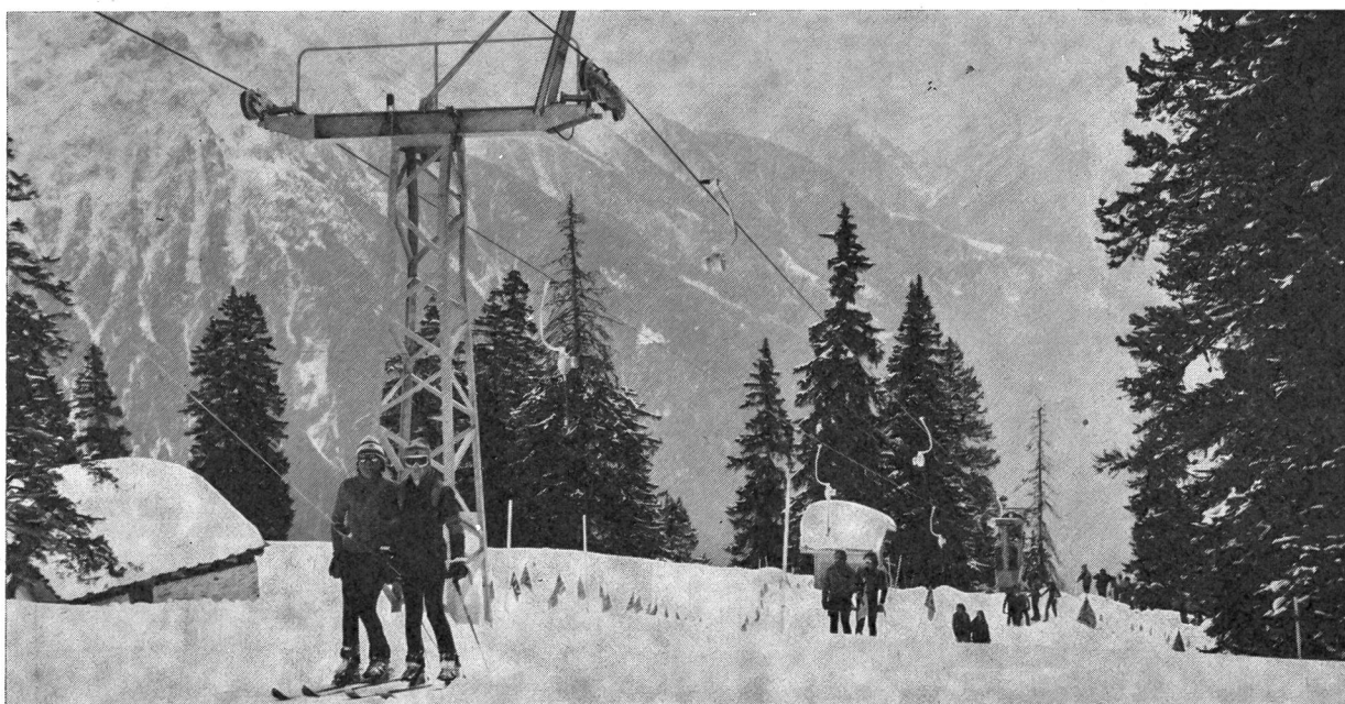
I partecipanti al corso hanno potuto beneficiare delle modernissime attrezzature di risalita che portano alla Bassa di Nara.