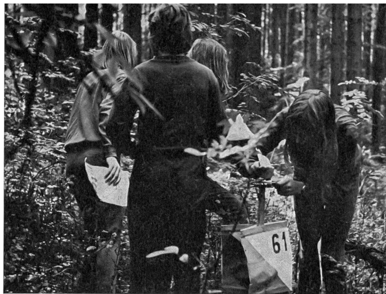
I concorrenti alle prime armi hanno faticato parecchio a trovare il posto 61. Dopo infruttuose ricerche, una componente della squadra annuncia un raggiante «è qui».