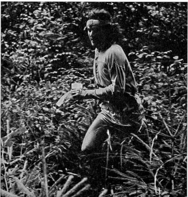
Correre sul terreno impervio, nella boscaglia, nel sottobosco, esige una pronunciata destrezza motoria che dev'essere ben sviluppata per diventare buoni orientisti.