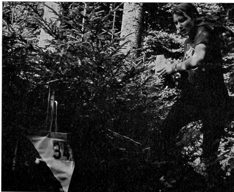
Con sicurezza questa partecipante entra nella zona del posto, un ultimo sguardo alla carta e alla descrizione del posto e già si trova davanti alla lanterna, la carta di controllo vien forata e già è scomparsa...