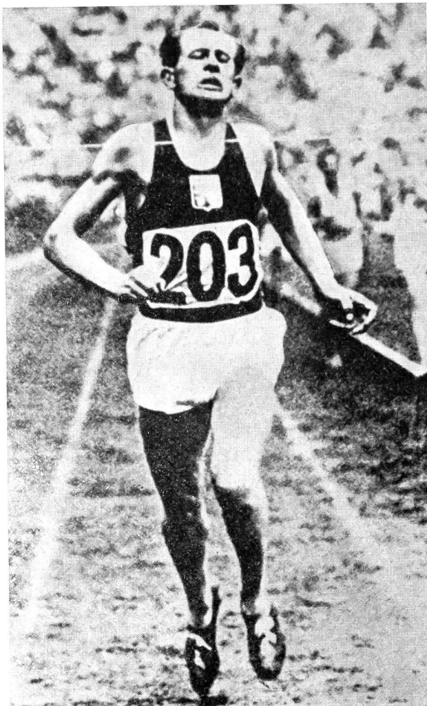
Zatopek, uno degli atleti che si sono «fatti» da soli!