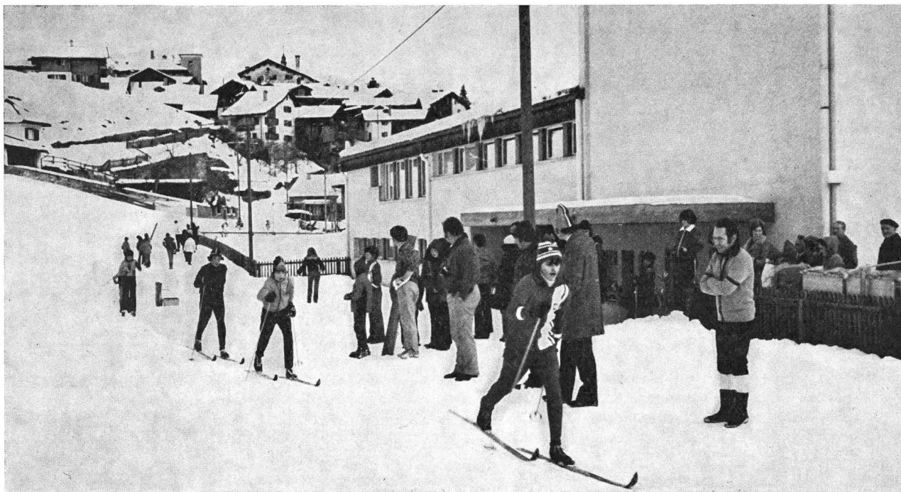
Giornata della porta aperta, a Spluga, dello Sci Club Melezza (in alto) — Posa d'obbligo al San Bernardino con partecipanti dello Sci Club Lumino (a lato) — La lunga coda per lo scilift del Calmotte dei partecipanti al corso G+S della STMG (sotto)