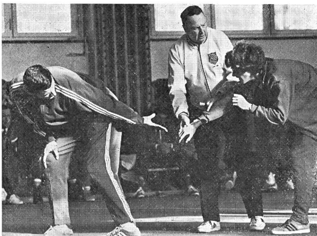
Bud Winter conosce la sua materia nei più piccoli dettagli . . . . .

Infine, e ciò è molto importante, nel periodo competitivo l'allenamento perde gran parte della sua intensità; al contrario gli scattisti di Winter partecipano ad una gara ogni volta che possono e non disdegnano neppure d'isciversi, nella stessa competizione, su varie distanze e spesso volte con eliminatorie. Dato che sono stati abituati durante la loro preparazione a subire una volta alla settimana dei test di prestazione, la competizione per loro si colloca a un livello superiore ma non per la qualità dello sforzo bensì soltanto nelle sue finalità.