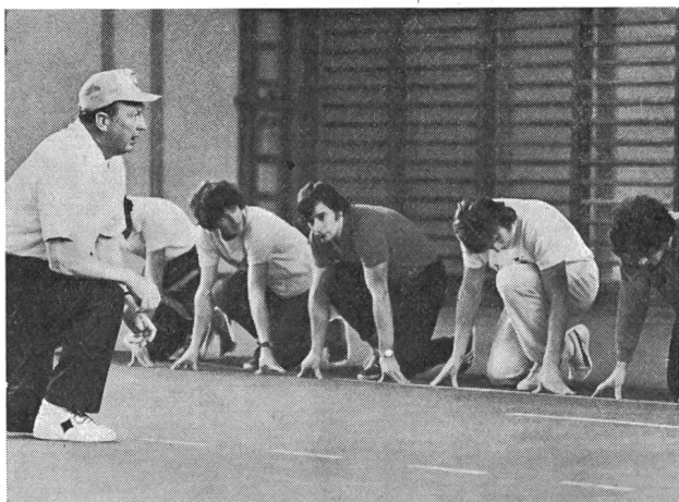
Scattisti svizzeri, numerosi ed attenti a Zurigo, ma che come per i germanici a Mainz Bud Winter non ha saputo che convincerli a metà!

Ci sforzeremo ora di condensare in poche parole essenziali la tecnica dello scatto secondo Bud Winter; faremo seguire questa presentazione dalle principali obiezioni espresse dagli specialisti germanici, ciò che potrà dar modo di giungere a deduzioni e confronti interessanti.