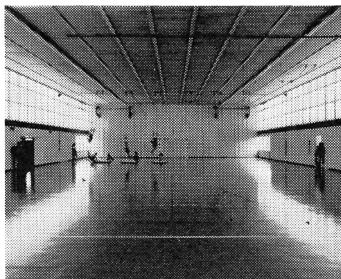
Grande salone di ginnastica Sarna a Adliswil. Sup. 20 x 40 m.

costruiti secondo le nuove norme della Scuola federale di ginnastica e sport di Macolin finite e pronte per l'uso con tutti gli abituali vani annessi