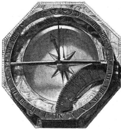
Reise-Kompass um 1780 PTT Museum Bern