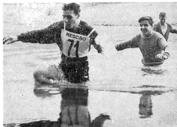
I famosi pattugliatori - nuotatori...

Cronometraggio con cronografi di precisione LONGINES Il NESCAO è il fortificante degli sportivi.