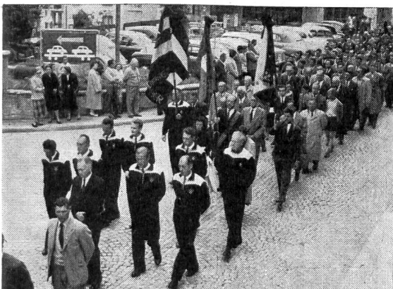
Nel mesto corteo funebre numerosa la delegazione di Macolin (a sinistra), presente pure al completo la rappresentanza del S. R. I. (a destra)