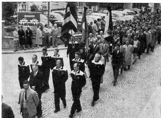
Nel mesto corteo funebre numerosa la delegazione di Macolin (a sinistra), presente pure al completo la rappresentanza del S. R. I. (a destra)