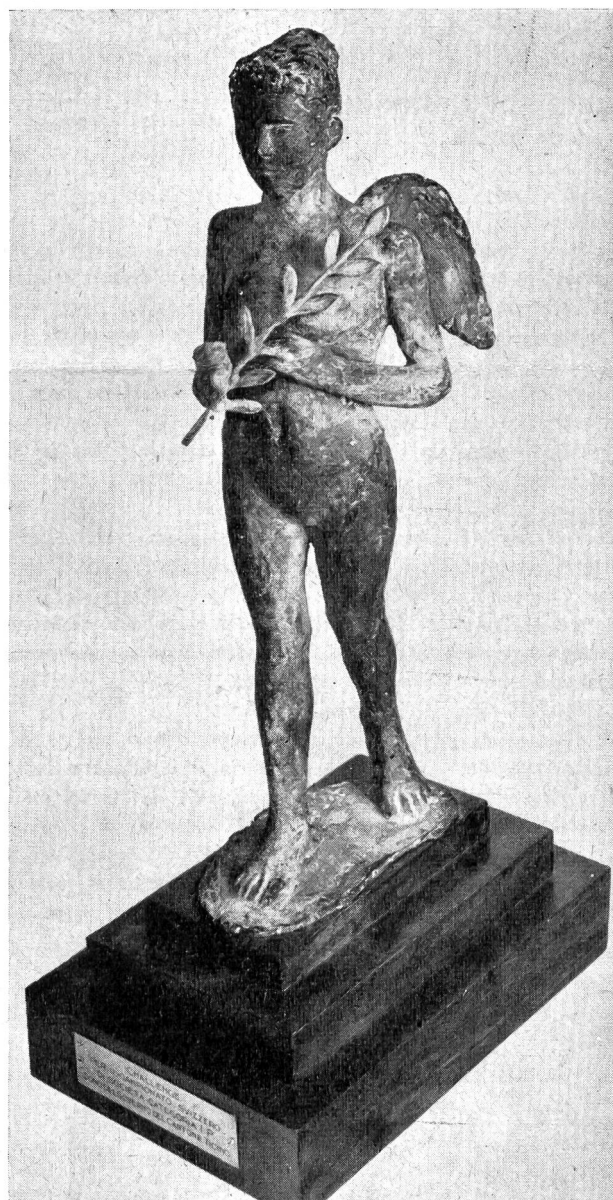
Vittoria alata scultura in bronzo di Irma Russo - Giudici (Chiasso), challenge per il campionato svizzero di società, categoria I. P., dono del Governo del Cantone Ticino

Non significa rispettare il proprio corpo il fatto di per-