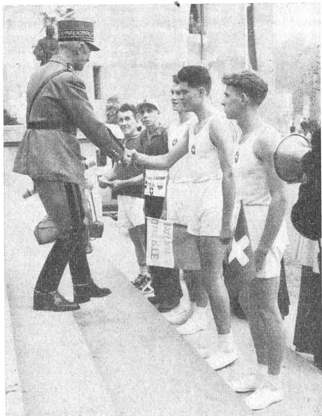
Il gen. Guisan ringrazia la gioventù svizzera per i graditi auguri

sanna e Ginevra e dell'Unione ticinese di Berna, e soprattutto il messaggio della gioventù svizzera che tre baldi giovani dell'I. P. gli hanno consegnato sulla piazza del Castello a Losanna. Centodieci giovani, ripartiti sugli altrettanti chilometri che separano Macolin da Losanna, si sono passati il messaggio scritto su una bella pergamena: dovunque la folla li ha applauditi, manifestando così il suo profondo attaccamento al Generale ed anche la sua simpatia per il movimento dell'istruzione preparatoria volontaria e per l'istituzione di Macolin, che oramai è diventata il centro di tutta l'attività sportiva di base del nostro paese. Messaggio semplice e bello quello che un giovanotto ha letto al Generale e che riproduciamo in questa pagina.