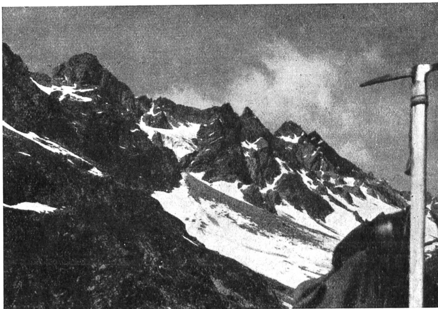
Il fascino della montagna attira i ticinesi ai corsi di alpinismo