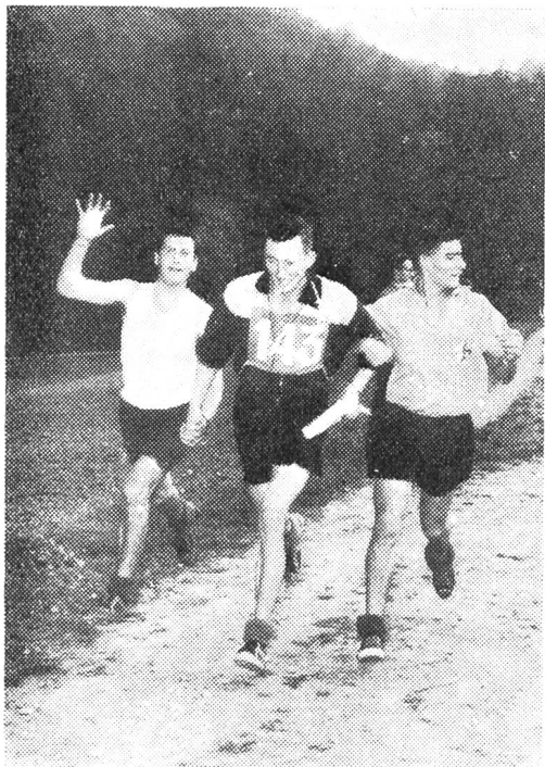
In tutte le corse di orientamento i più forti aiutano i deboli per poter terminare uniti la gara

La nostra corsa, la tanto attesa corsa di orientamento, la corsa più bella che potrebbe da sola riempire per contenuto e validità sportiva tutto il calendario sportivo autunnale, che compendia in certo qual modo l'attività I.P. del Cantone, che chiama a raccolta la gioventù ticinese di ogni luogo e di ogni tendenza sportiva per unirli un giorno in una tenzone che è di tutti, che ha ancora il carattere diamantino del vero sport, che ha ancora la peculiarità (quasi un miracolo) di avere più attori che spettatori, era cresciuta bene come tutte le altre dei passati anni in un clima di passione, di amorosa cura in un piovoso autunno che faceva disperare e invocare il sole. I preparativi procedevano bene, una sola posta era e rimaneva ancora in sospeso e allarmava: il tempo. Noi si scrutava l'orizzonte come aruspici per carpire un segno di speranza, di incoraggiamento. Troppo vivo era il ricordo della corsa tenuta nel Locarnese, sotto scrosci irosi di pioggia, che ci aveva mostrato una gioventù gagliarda, sorridente, entusiasta anche nell'inclemenza del tempo. Una bella dimostrazione come risposta a coloro che nella gioventù vedevano solo il male, che la dipengevano in nero e solo sulla via del facile, della mollezza. Per una volta tanto era qualche cosa di forte, robusto.