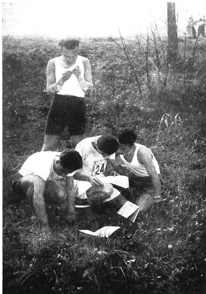
Una scena alla seconda edizione della corsa (1948).