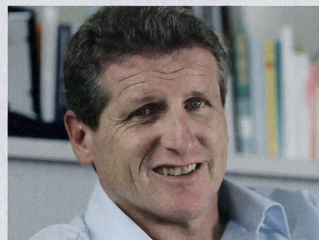
Walter Mengisen est recteur de la HEFSM et directeur suppléant de l'OFSPPO.

Un bon enseignant d'éducation physique doit disposer de solides connaissances en sport et éducation physique, d'un bagage théorique approprié et de vastes habiletés motrices. Les personnes les mieux formées devraient enseigner à la base. Dans la réalité, c'est toutefois l'inverse: mieux on est formé, plus haut est le degré dans lequel on enseigne!